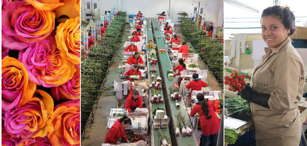
Các nữ công nhân Colombia làm việc trong dây chuyền đóng gói hoa hồng