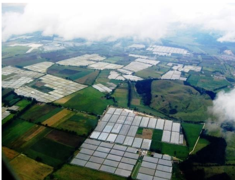
Các trang trại trồng hoa ở Botoga Savannah

Ngành công nghiệp hoa của Colombia được thiết lập một cách vững chắc ở các cao nguyên đầy nắng bên ngoài hai thành phố lớn nhất là Bogota và Medellin. Bogota Savannah chiếm 73% sản lượng hoa ở Colombia và thung lũng Rionegro gần Medellin chiếm 24%, còn lại 3% nằm rải rác khắp khu vực trung tâm và phía tây của Colombia. Nhiệt độ mát mẻ, đất đai phì nhiêu, ngày dài (do gần đường xích đạo) và lao động dồi dào giúp Colombia trồng hoa hồng quanh năm mà không cần tới những nhà kính tăng nhiệt đất tiền.