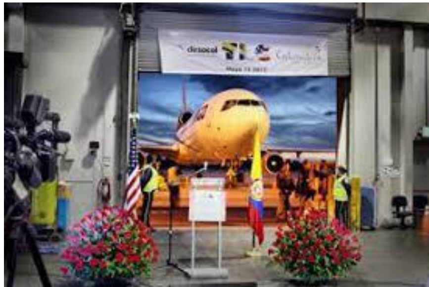
Nghi lễ tại hãng hàng không El Dorado, Bogota đánh dấu sự khởi đầu của hiệp định CTPA

Ngày 15 tháng 5 năm 2012, Hiệp định Xúc tiến thương mại giữa Hoa Kỳ và Colombia (CTPA-Colombia Trade Promotion Agreement) chính thức có hiệu lực. Nó được đánh dấu bằng chuyến bay chở đầy hoa cất rời khỏi sân bay El Dorado của Thủ đô Bogota ngay trước nửa đêm ngày 14 tháng 5 năm 2012. Khi nó đáp xuống sân bay quốc tế Miami vào sáng sớm ngày 15 tháng 5, CTPA đã được thực hiện hiệu quả, loại bỏ các biểu thuế trên hầu hết các sản phẩm Colombia. Vì thế, hoa cắt đã trở thành sản phẩm đầu tiên của Colombia được hưởng lợi từ CTPA.