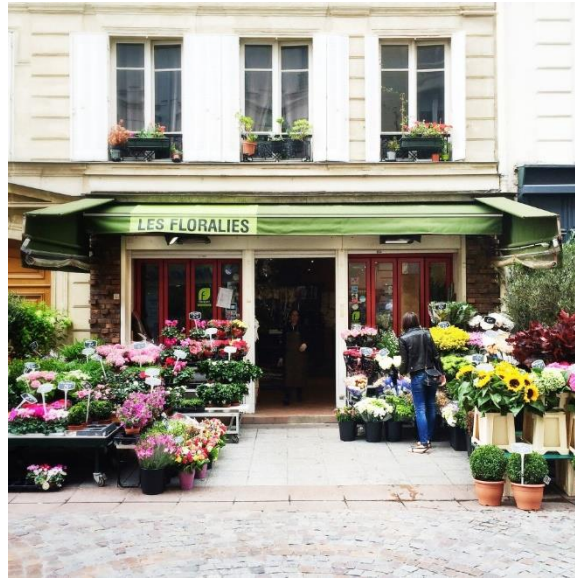
Một cửa hàng hoa tươi tại Pháp

Pháp cũng là nhà nhập khẩu hoa và cây lấy lá (lá trang trí) lớn thứ tư sau Hà Lan, Đức và Ý. Một điều khá đặc biệt là hầu hết các loại hoa nhập khẩu vào Pháp đều đến từ các nước thuộc Châu Âu. Điều này được lý giải do Pháp có mối quan hệ kinh doanh tốt với các nước châu Âu khác về lĩnh vực thương mại hoa cắt cũng như do thị hiếu và sở thích của người tiêu dùng Pháp. Các loại hoa được nhập khẩu vào Pháp gồm: hoa hồng (hoa cắt phổ biến nhất ở Pháp), hoa tulip, hoa lan, hoa cúc và hoa cẩm chướng. Các nhà cung cấp chính của những bông hoa cắt này là từ Hà Lan (khoảng 80%), tiếp theo là Ý và Tây Ban Nha.