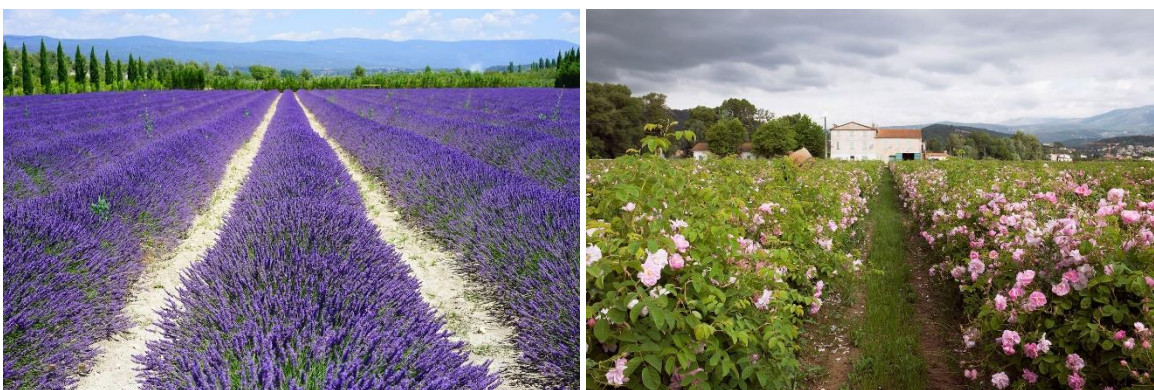
Hoa oải hương và hoa hồng được trồng để sản xuất nước hoa

Hoa đóng một vai trò quan trọng trong cuộc sống của người dân Pháp. Họ sử dụng hoa cắt cành để tặng nhau trong các dịp lễ, tết; sử dụng hoa chậu để trang trí nhà cửa và sử dụng hoa để cung cấp nguyên liệu (tinh dầu) cho ngành công nghiệp nước hoa vốn nổi tiếng nhất trên thế giới. Các loại hoa được sử dụng để làm nước hoa tự nhiên bao gồm hoa nhài, hoa hương thảo, diên vĩ, oải hương và hoa hồng.