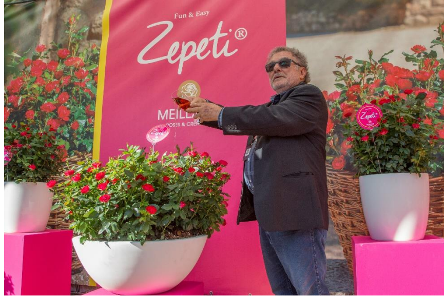
Lễ giới thiệu giống hoa hồng mới 'Zepeti' tại Công ty Meilland